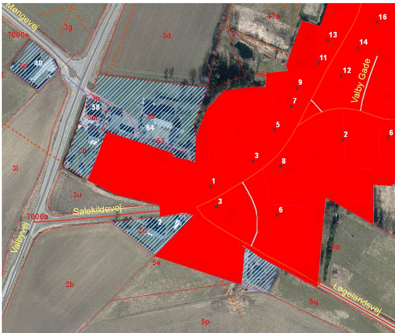
Figur 1 Kloakopland VAL11SN (del af Valby), markeret med stiptet de ejendomme der udtages af spildevandsplanen som kommende kloakeringsopland. Rød markering er kloakeret

*) Befæstet areal der anvendes til kloakken